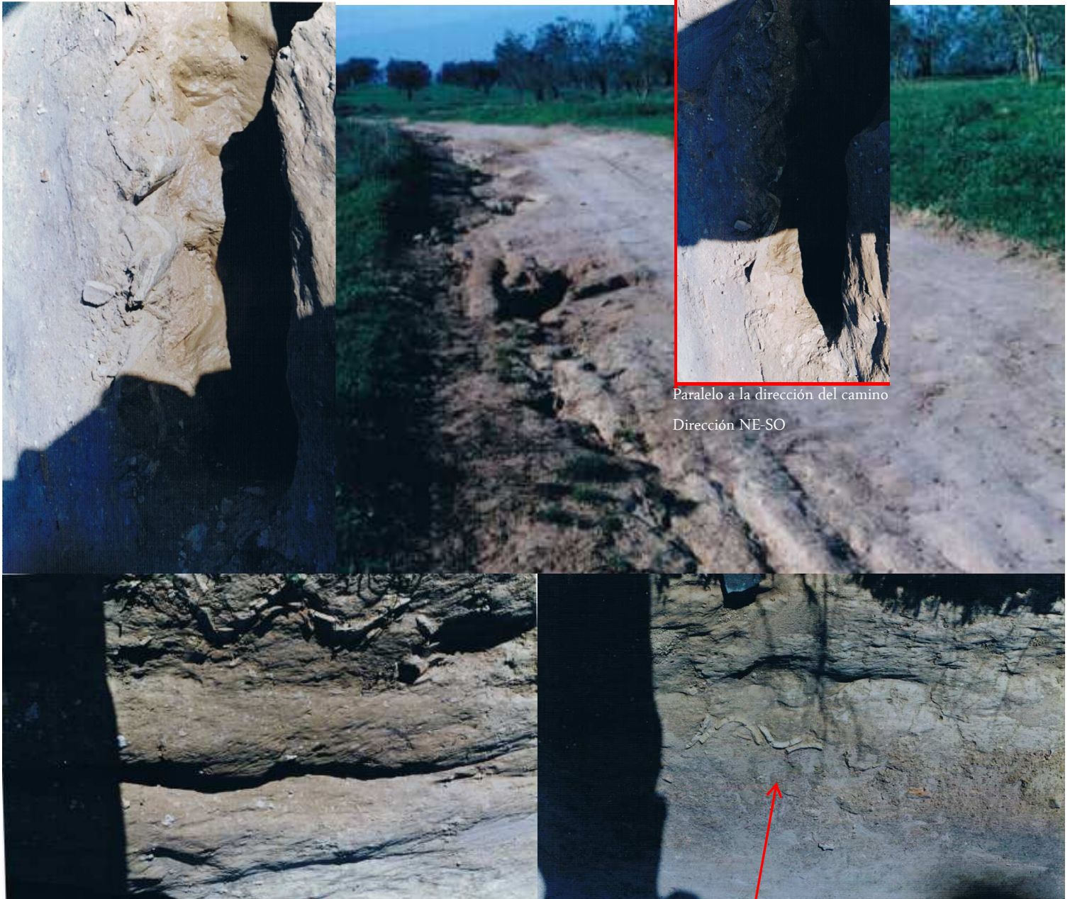
Paralelo a la dirección del camino Dirección NE-SO

Antiguo enterramiento árabe, formado por tejas de barro colocadas verticalmente rodeando el cuerpo del difunto. Apareció en uno de los caminos de Chillas, en los surcos causados por las escorrentías provocadas por las lluvias de aquellos años. Hoy día el enterramiento está sepultado bajo el nuevo camino.