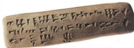
Ejemplo de impresión cuneiforme sobre arcilla húmeda.

Este hallazgo puede suponer un eslabón entre la escritura cuneiforme y la escritura romana, no en un sentido de continuidad de la propia escritura sino en un sentido cultural, en cuanto a la finalidad de engrandecer los actos a través del recuerdo del pasado.