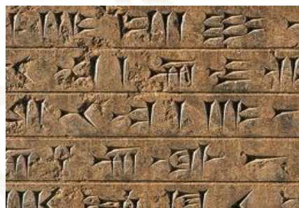
Escritura cuneiforme sobre tablilla sumeria